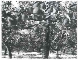
収穫をまつ りんごたち

風によって枝に擦れたりりんごはキズが残る商品価値がなくなります。そんなりんごを農家さんから「見た目は悪いけど味は変わらないから」と頂くことがあります。食べてみると、実はキズりんごは結構美味しいものなのです。