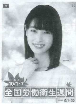
10/1・7 全国労働衛生週間 9/1・30

本年度を初年度とする国の「第十三次労働災害防止計画」では、労働者の健康確保、過重労働の防止、メンタルヘルス対策等の必要性が大きく取り上げられました。