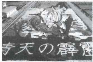
田舎館村 田んぼアート 刈り入れ途中の様子

え、九月下旬には刈り取りがあり、どちらも体験ツアーがあります。余談ですが、私が昨年十月上旬に田んぼアート会場に行ったところ、すでに刈り取られ、後の祭りでした。確認してから行きましょう。