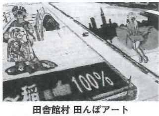
田舎館村 田んぼアート

しかし、驚いたことにただの田舎ではなく元祖！田んぼアートの村だったので。田舎館村役場の建物は天守閣が上階に乗っていて、その面白く奇妙なビジュアルの天守閣から田んぼアートが観覧できるのです。田んぼアートは二十五年前にスタートし、当初は色の異なる三種の稲からはじめましたが、現在では十二種類の稲を絵の具代わりに使って巨大な絵を描きます。それは年々巧妙になり素晴らしい芸術作品となっています。