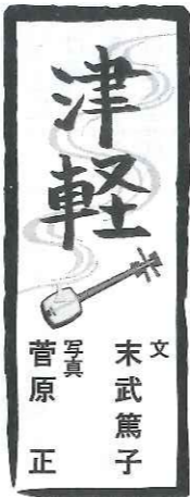
文 末武篤子